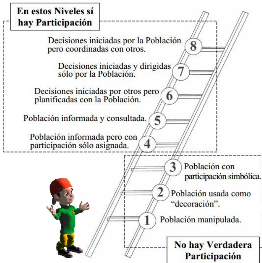
Figura 3. Escala de participación según Roger Hart

Participación manipulada: Es la que se da cuando la población es utilizada para realizar acciones que no entienden y que responden totalmente a intereses ajenos a los suyos. Un buen ejemplo de ello podemos verlo en las campañas políticas que usan a la población llevando pancartas, sólo para recibir a cambio una prebenda.