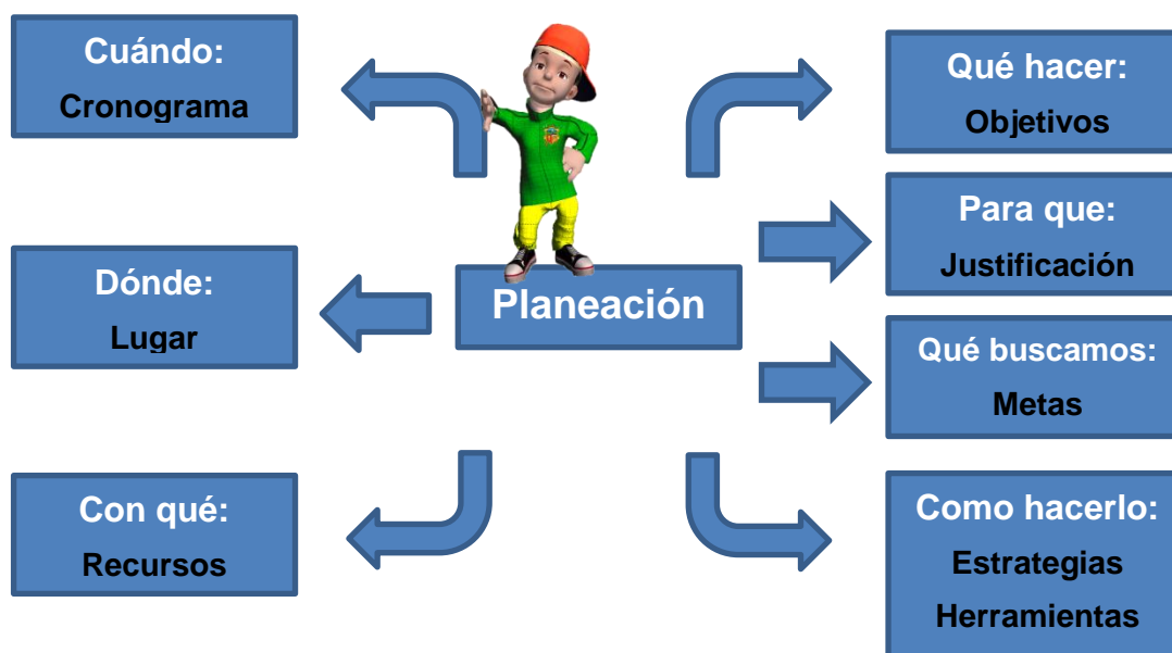
Figura 1. Componentes de la planeación

El plan de acción se puede ejercitar al contestar varios interrogantes. Sus componentes varían en orden, según las necesidades específicas de la comunidad o durante la preparación y ejecución de un proyecto. En el siguiente cuadro se ilustran estos componentes: