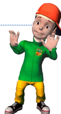
Figura 3. De lo grupal a lo institucional

Como se indica en las figuras 2 y 3, todas las combinaciones de relaciones de los grupos se pueden dar en los procesos de cambio social participativo, los cuales constituyen el factor que motiva la conformación de otros grupos que tienden a ser más formales y que se denominan secundarios, como son los de producción, los religiosos y los profesionales.