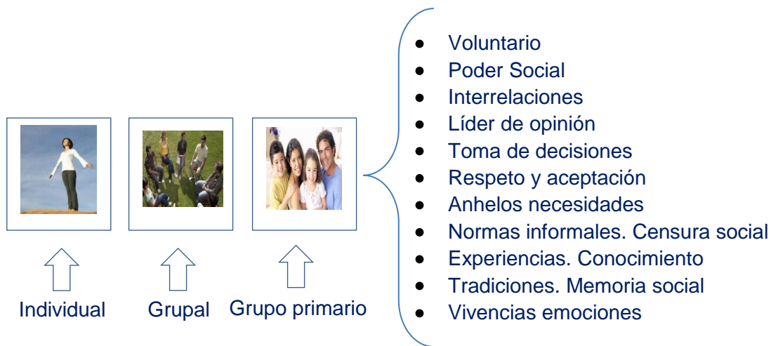
Figura 2. De lo Individual a lo grupal

Ambos tienen diversidad de relaciones en su conformación y evolución, tal como se muestra en las siguientes figuras: