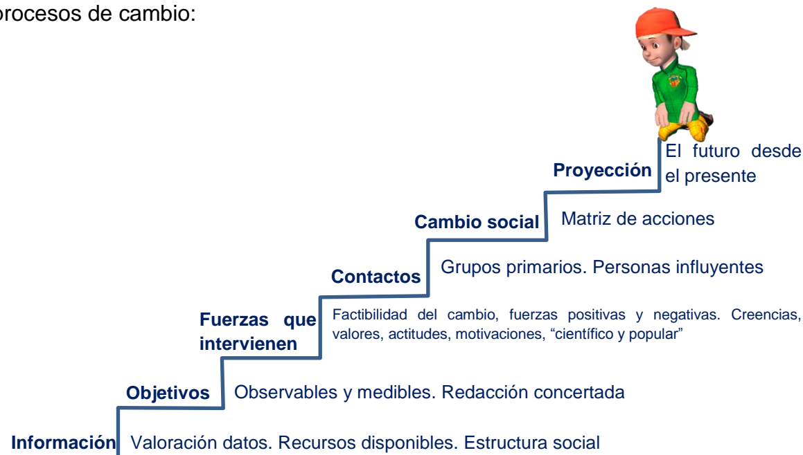
Figura 1. Escala de valores en los procesos de cambio

A su vez, esta identificación de factores permite construir la siguiente escala en los procesos de cambio: